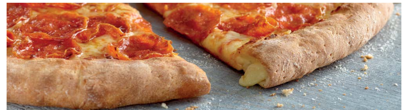
Ciasto tradycyjne z serowym brzegiem