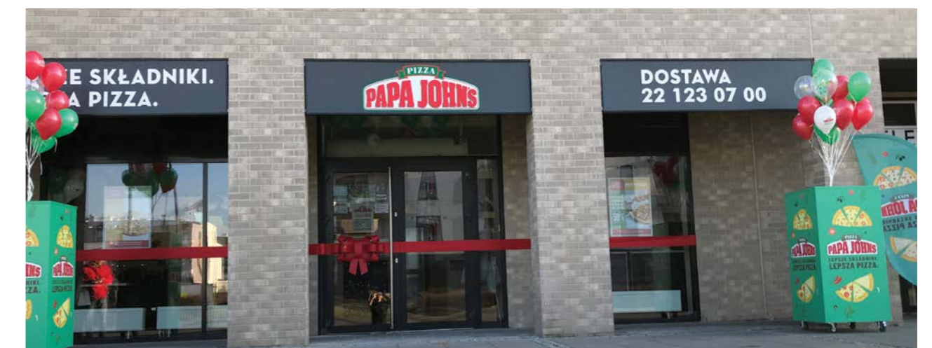
Aleja Rzeczypospolitej 22

Restauracja z miejscami siedzącymi i realizująca zamówienia z dostawą